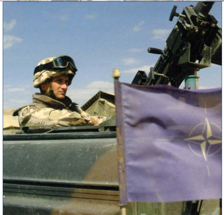
могући (као случај жичаре у Италији), али такав ризик прихватају све државе без изузетка.

Досадашњи вишегодишњи транзитни Алијансе преко наше територије одвијали су се без иједног инцидента и уз добру сарадњу с Натоом. Једини проблем је представљала наплата пружања услуга ескорта. Инциденти са трагичним исходом су увек