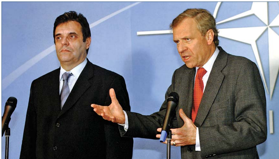
Развијање сарадње Северноатлантског савеза и Београда: Премијер Србије Војислав Коштуница и генерални секретар НАТОа Јап де Хоп Схефер

Како се овај безбедносни систем темељи на кључним вредносним постулатима развијеног западног света као што су заштита демократских начела, владавине права и грађанских слобода, додатан значај има и његова функција стабилизатора и гаранта демократског развоја сваке појединачне земље учеснице. Ово је посебно важно за Србију и њен углед у међународним односима узимајући у обзир турбулентни период кроз који је наша земља прошла од краја Хладног рата до данас.