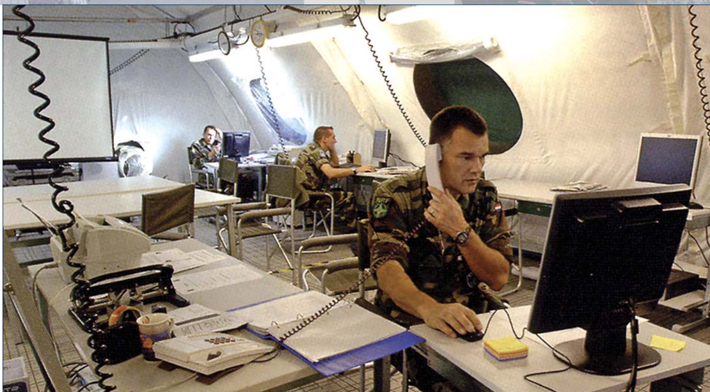
Улазак у Партнерство омогућава и ширу употребу нових технологија за стварање ефикасних оружаних снага

пређење финансијске сарадње, бољу међународну препознатљивост земље, повећање трговинске размене са већим заступљеношћу на тржишту чланица Натоа и ЕУ, развој наменске производње на вишем нивоу, пораст сектора услуга, побољшање саобраћајне инфраструктуре (путеви, железница и др.), раст прилива од туризма... Све то обезбеђује динамичан и одржив друштвено-економски развој. У скоро свим овим земљама буџет је уравнотежен, запосленост у порасту, а инфлација ниска и под контролом. То су чињенице и лако их је проверити.