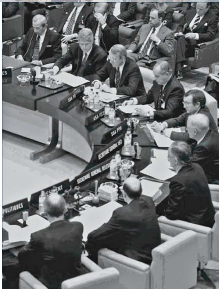
Историјски Самит у Бриселу јануара 1994.

На Самиту НАТОа у Лондону, јула 1990. године, предложени су нови облици сарадње са земљама бившег Источног блока. У де-